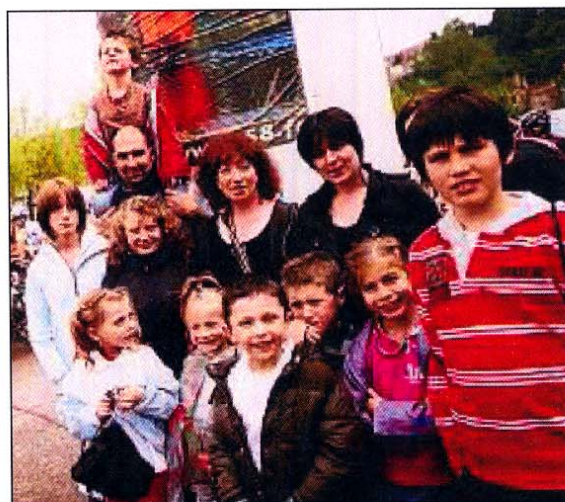
ENFANTS. Les jeunes résidents de la Maison départementale de l'enfance et de la famille (Madef) étaient les invités du TNM.