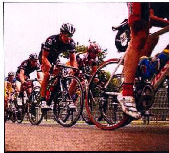
PELTON. Tel un chat, le peloton a laissé les échappés s'amuser. Mais il a fondu sur eux en fin de course.