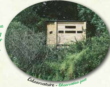
L'observatoire - Observation post

The ferryman of the Bec d'Allier, who in the past would ferry people across from one bank to the other, will accompany you all along the trail (4 km long taking about 2 heures for the return trip). He will also explain the different types of natural environment you will come across on the way. If you do not have a lot of time, a shorter trail is available (2,5 km long taking about 1h15 mn).