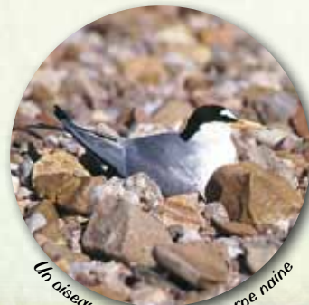
Un oiseau des grèves : la stérne naine The little tern

A l'aide de panneaux d'information, il vous présente différents milieux naturels : forêts alluviales, grèves, prairies, falaise d'érosion. Il vous guide jusqu'à l'observatoire vous permettant ainsi de découvrir la confluence de la Loire et de l'Allier.