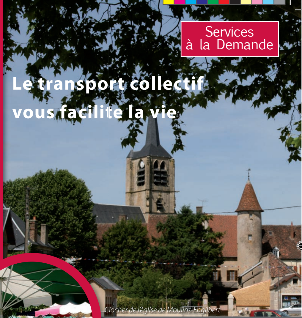
Clocher de l'église de Moulins-Engilbert