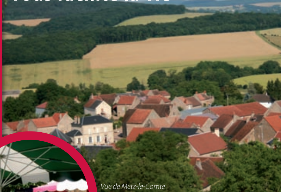
Vue de Metz-le-Comte