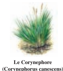
Le Corynephor (Corynephorus canescens)