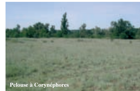
Pelouse à Corynéphores

“Fiber, a beaver by trade, will be your guide on this site which is made up of two footpaths”