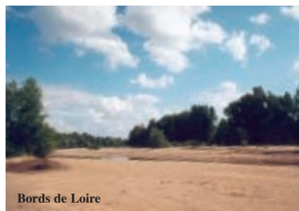
Bords de Loire

A beaver that sharpens trees like pencils, a powerfully silent river... From the sandy riverbanks to the surrounding forests, come and discover this natural and refreshing patchwork !