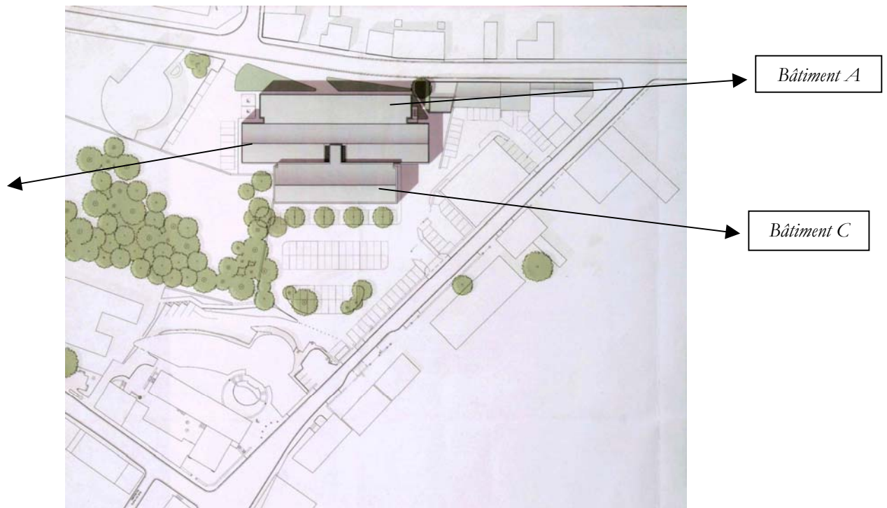
Le plan masse du futur bâtiment