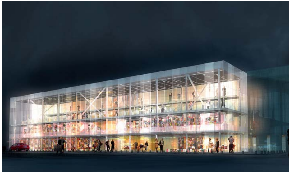
La façade avant du futur bâtiment

dématérialisés). Ils comprendront aussi une salle d'exposition, une salle de conférences et une salle pour le service éducatif.