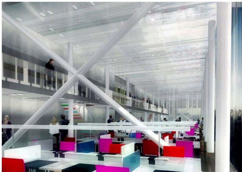
La future salle de lecture

Les nouveaux espaces dédiés au public accueilleront simultanément 90 personnes dans les salles de lecture (documents traditionnels, microfilms, documents audiovisuels et dématérialisés). Ils comprendront aussi une salle d'exposition, une salle de conférences et une salle pour le service éducatif.