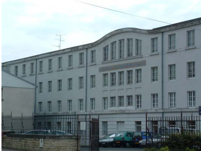
Le bâtiment datant de 1927 avant le début des travaux

Il concerne le bâtiment actuel des Archives départementales, datant de 1927, qui sera réhabilité et agrandi.