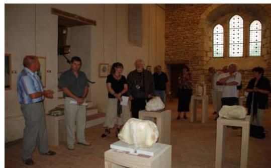
Parmi de nombreuses expositions, vernissage des oeuvres de deux artistes hollandais, à La Chapelle de Corbelin