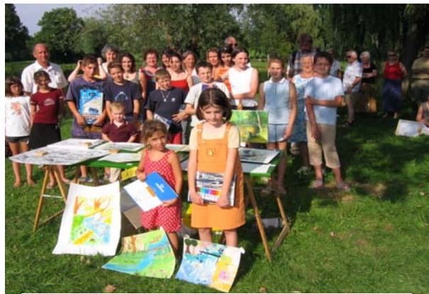
Journée des peintres, organisée par l'OTSI et soutenue par le Conseil Général