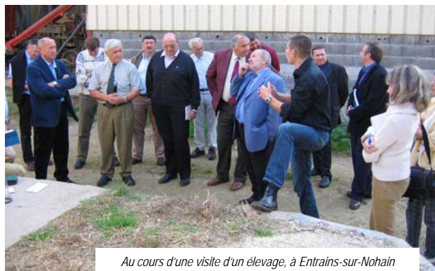
Au cours d'une visite d'un élevage, à Entrains-sur-Nohain

Que 2008 vous permette de concrétiser vos projets,