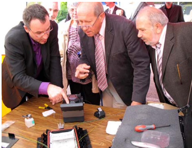
Point presse le 04/10/07 de la tête de réseau et soudure de la fibre optique

C'est parti ! Permettre aux entreprises de s'installer dans notre département et d'y réussir, à celles déjà installées d'y rester et de gagner sur le marché national et international, permettre à chaque nivernais de vivre enfin dans son temps, d'avoir accès au meilleur de la technologie pour travailler, se soigner, se former, se divertir : c'est l'ambition du Conseil Général de la Nièvre et de l'Agglomération de Nevers.