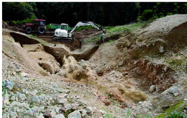
La minière de la Pâturage des Grangerands en fin de fouille.

Responsable : Béatrice CAUJEU (CNRS-TRACES, Toulouse)