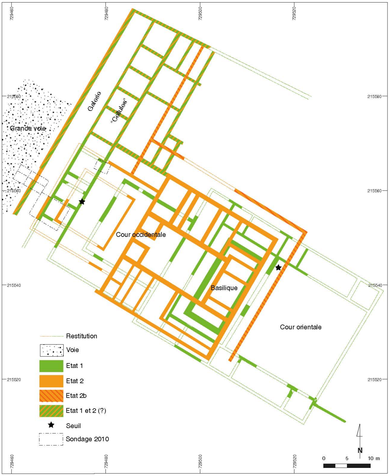
Plans des états maçonnés du quartier de la Pâturage du Couvent à l'issue de la campagne 2010)