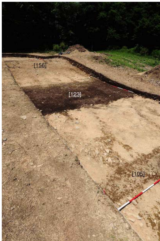
Vue d'ensemble du sondage du Porrey (le talus du rempart [156], le fossé [123] et la première des deux palissades [105])

Responsable : Otto H. URBAN (université de Vienne)