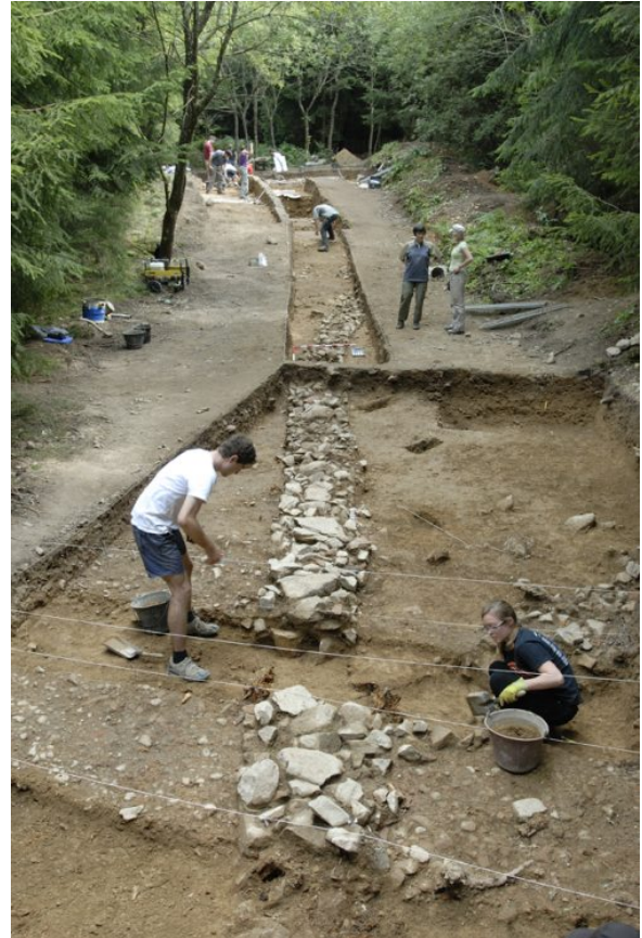
Vue d'ensemble du sondage aux Sources de l'Yonne

de la sédimentation archéologique et la datation de l'occupation des grandes terrasses artificielles qui occupent le versant droit de l'Yonne. Les résultats sont très positifs, puisqu'on met en évidence une occupation dense, stratifiée et très structurée (pavements d'amphores, installation de forge...) contemporaine de l'oppidum.