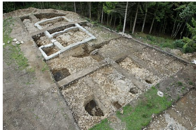
Vue d'ensemble du chantier du Theurot de la Roche

Le Theurot de la Roche est une des trois éminences du Mont Beuvray, dont le sommet est un replat artificiel. La fouille de ce secteur, engagée en 2008 par Thierry Luginbühl (université de Lausanne), révèle une succession d'aménagements complexes, certains se traduisant par d'importantes excavations dans le rocher (forts calages de poteaux, cave, citerne (?)...). Le dernier état de construction se manifeste par un petit bâtiment maçonné à trois pièces. On présume de la vocation cultuelle à l'endroit. Pour la campagne 2011, on se propose de terminer l'exploitation du secteur déjà ouvert, d'élargir la fouille vers le nord sur le plateau sommital et d'effectuer un sondage sur le flanc sud du plateau.