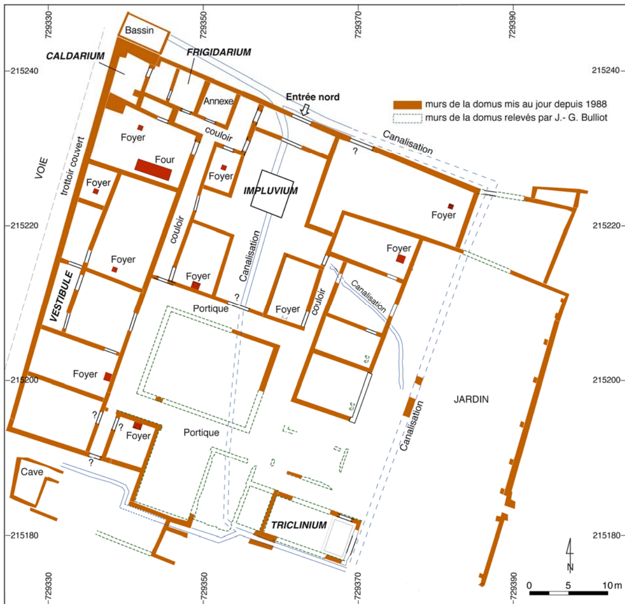
Plan de la domus PC1 à l'issue de la campagne 2010