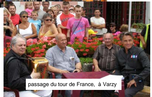
passage du tour de France, à Varzy