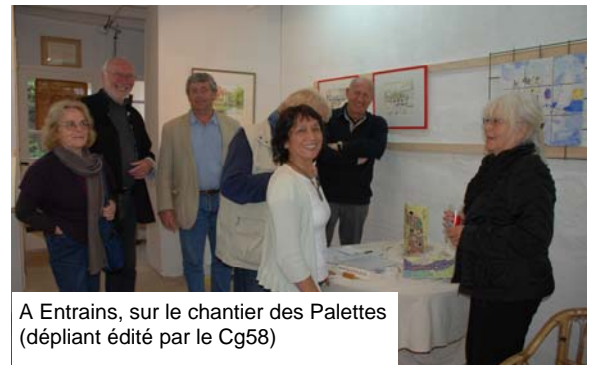
A Entrains, sur le chantier des Palettes (dépliant édité par le Cg58)

Extension, à Entrains du service de transport à la demande en direction de Cosne et de Clamecy (prix forfaitaire de 6€ pour le client)