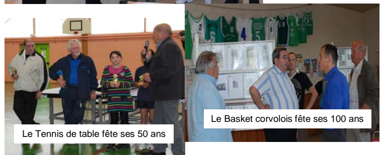
Le Tennis de table fête ses 50 ans