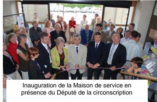
Inauguration de la Maison de service en présence du Député de la circonscription