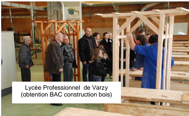
Lycée Professionnel de Varzy (obtention BAC construction bois)