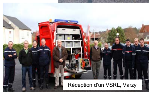
Réception d'un VSRL, Varzy