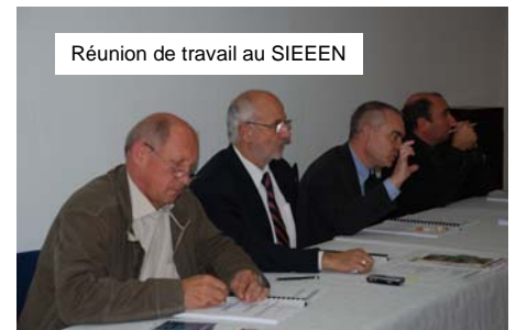
Réunion de travail au SIEEEN