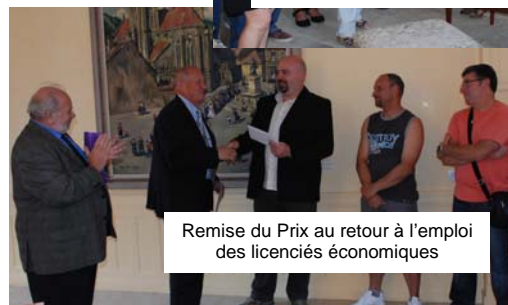
Remise du Prix au retour à l'emploi des licenciés économiques