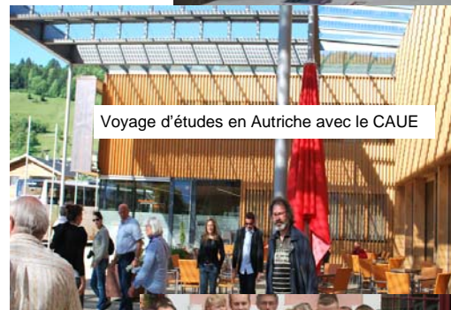
Voyage d'études en Autriche avec le CAUE