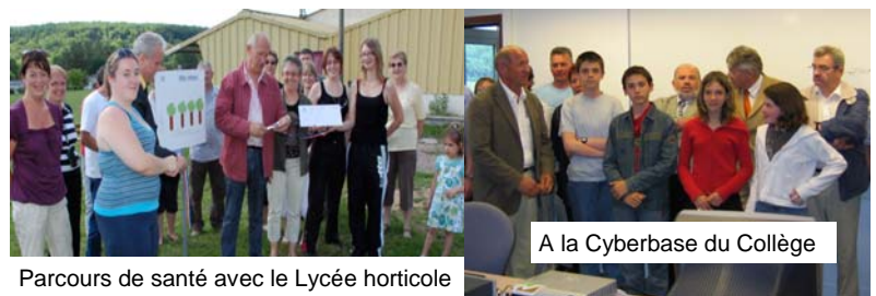
Parcours de santé avec le Lycée horticole