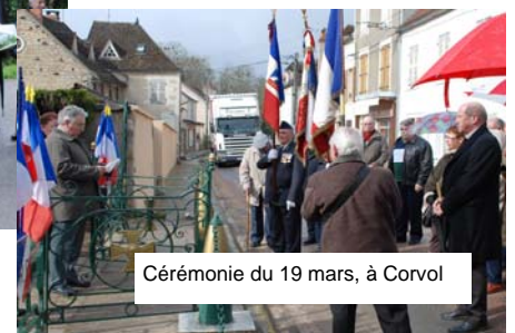
Cérémonie du 19 mars, à Corvol