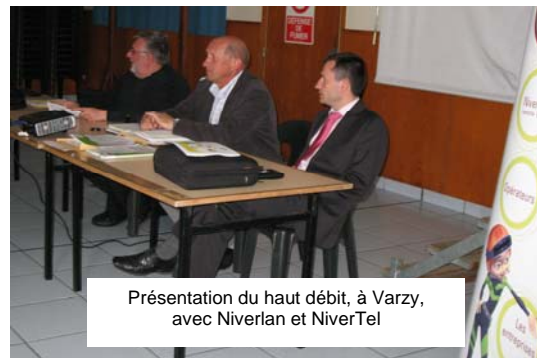
Présentation du haut débit, à Varzy, avec Niverlan et NiverTel

Pour toute information, un seul numéro : 0 810 58 00 58 (numéro AZUR - prix d'un appel local)