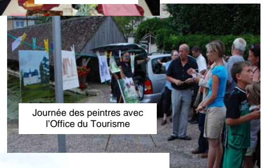
Journée des peintres avec l'Office du Tourisme