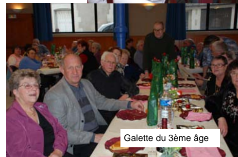
Galette du 3ème âge