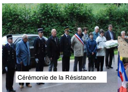
Cérémonie de la Résistance