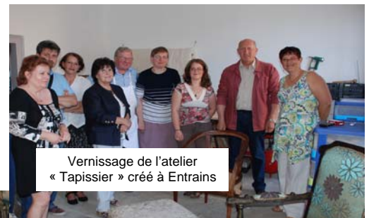
Vernissage de l'atelier « Tapissier » créé à Entrains