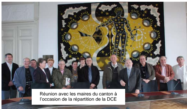
Réunion avec les maires du canton à l'occasion de la répartition de la DCE

En 2008, 2009 et 2010, outre mes responsabilités au sein de la commission « Solidarité » du Conseil Général et ma vice-présidence à la Communauté de Communes en charge de l'économie - lourde charge en cette période difficile - j'assume de nouvelles fonctions : la vice-présidence de Niverlan et de la Commission des droits à l'autonomie des personnes handicapées et aussi la présidence du Conseil d'Architecture d'Urbanisme et d'Environnement. Ces nouvelles missions que j'ai choisies me permettent de mieux appréhender les problèmes du canton dans les domaines de la santé, de l'économie, des nouvelles techniques de communication et de l'habitat.