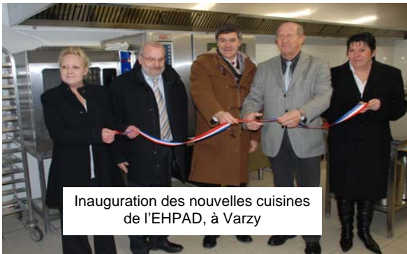
Inauguration des nouvelles cuisines de l'EHPAD, à Varzy