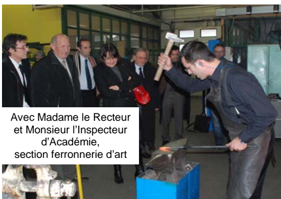
Avec Madame le Recteur et Monsieur l'Inspecteur d'Académie, section ferronnerie d'art